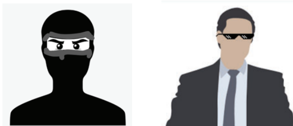
Enkele schetsen gemaakt door ooggetuigen

Hier volgt een politiebericht uit Kasterlee in België: De laatste weken is er in ons mooie dorpske een ondergrondse oorlog ontstaan tussen 2 nog onbekende partijen. Beide partijen zijn vrij geheimzinnig en we zijn er nog niet in geslaagd deze groepen te identificeren. Er gaan geruchten rond via de ondergrondse kanalen waaruit blijkt dat een van deze